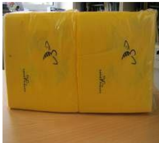
Servietten 150 Stück 8,50 Euro