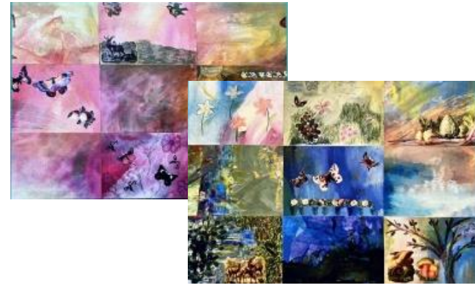
Postkartensets á neun Karten 3 Euro