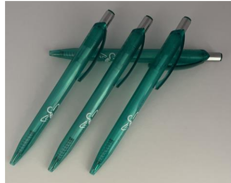
Kugelschreiber St. 0,50 Euro