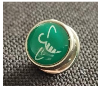
Ansteck-Pin 1,80 Euro