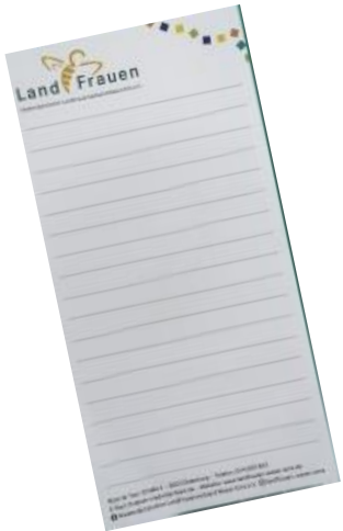
Blöcke 1 Euro