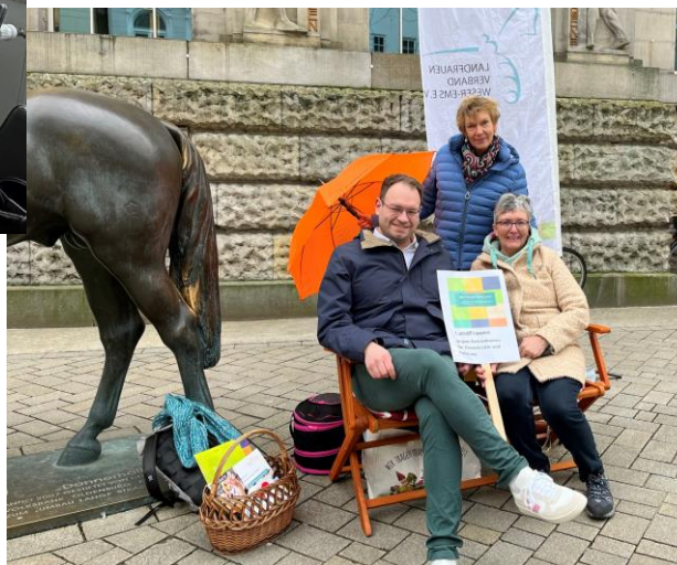
Demokratie meint Dich!

Hinweis: Das Projekt „Hereinspaziert“ wird nicht mehr stattfinden.