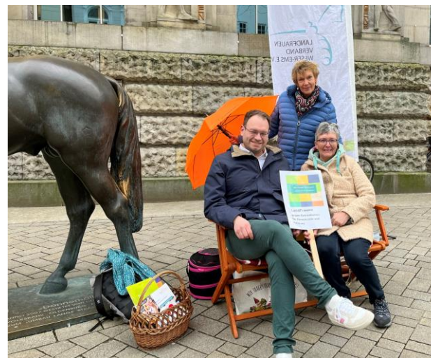
Demokratie meint Dich!

Hinweis: Das Projekt „Hereinspaziert“ wird nicht mehr stattfinden.