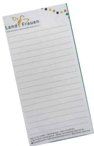
Blöcke 1 Euro