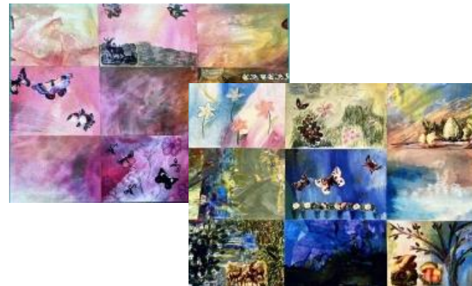
Postkartensets á neun Karten 3 Euro