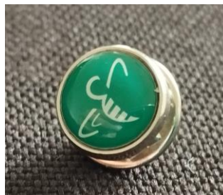
Ansteck-Pin 1,80 Euro