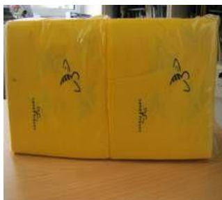
Servietten 150 Stück 8,50 Euro