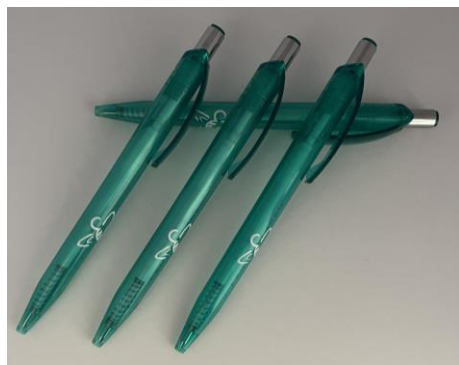
Kugelschreiber St. 0,50 Euro