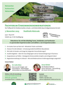
Flyer Fachforum Einkommenskombination, LWK

Die Landwirtschaftskammer Niedersachsen (LWK) ist ein starker Partner der LandFrauen. Unsere Räumlichkeiten befinden sich nicht nur in direkter Nachbarschaft, auch in der Zusammenarbeit pflegen wir einen engen Kontakt. Beispielsweise sorgt die LWK dafür, dass unsere LandFrauen im Projekt Verbraucherbildung mit Kindern und Jugendlichen bestens qualifiziert werden. Ein Blick in das Veranstaltungsverzeichnis der LWK lohnt sich: https://www.lwk-niedersachsen.de/lwk/vera .