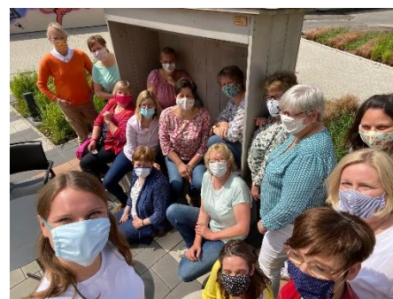
Mittagspause beim Workshop in Oldenburg